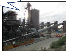
CSG 製造プラント (南区)