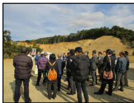
阿蔵山土採取現場 (天竜区)