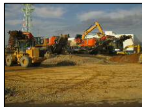
中継破碎場 (浜北区)